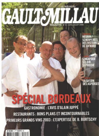
Magazine GaultMillau Juin/Juillet 2004

Bordeaux Primeurs 2003 : Graves rouges et blancs : souffrir... une habitude