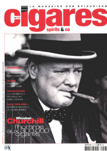
Cigares spitts & Co Juin/Juillet 2004

Pessac-Léognan Château Larrivet-Haut-Brion Note : 87-89/100