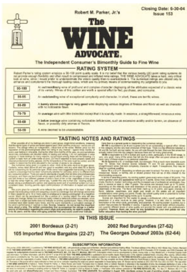
Wine Advocate - Juin 2004

Primeurs 2003 : La notation des vins de Bordeaux 2003 de Robert Parker pour The Wine Advocate.