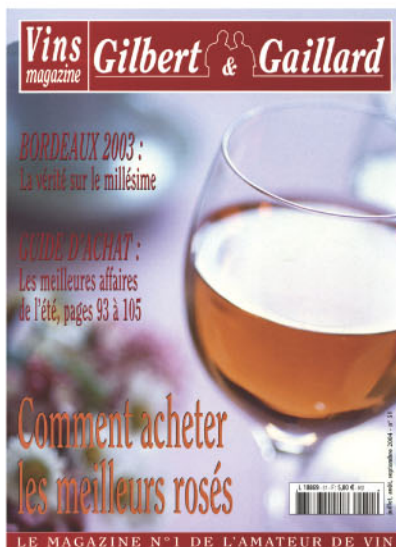
Vins Magazine - Gilbert & Gaillard Juillet/Août/Septembre 2004

Pessac-Léognan Blancs Bonne Impression : Château Larrivet-Haut-Brion