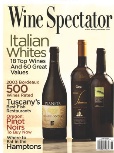
Wine Spectator - June 30, 2004 Tasting Report : Bordeaux 2003

Graves & Pessac-Léognan Château Larrivet-Haut-Brion Pessac-Léognan 2003 - 84/100